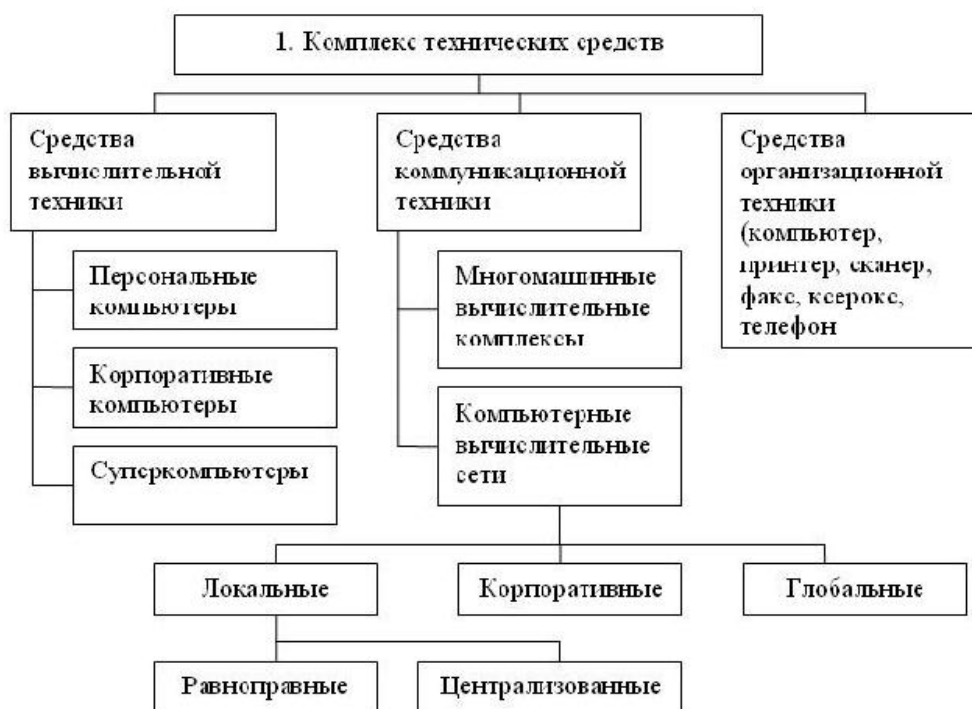
Рисунок 1 - Структура комплекса технических средств АИТ